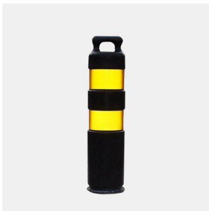
Figura Ilustrativa para Referência

Para uso permanente, pino de fixação direta no solo, ultra flexível e resistente a impactos. Corpo preto, faixas refletivas amarelas, autoadesivas (largura 150mm) norma NBR. 14.644. MEDIDAS: 80cm X 19 diâmetro. MATERIAL: POLIURETANO.