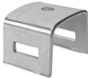
Figura Ilustrativa para Referência

Braquetes galvanizados a fogo para a fixação de placas de sinalização, outros equipamentos em postes e tubos.