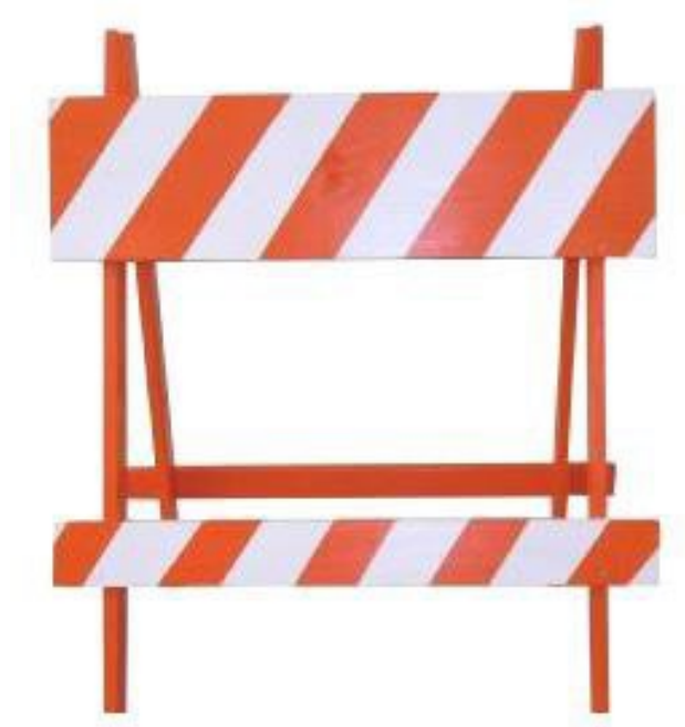
Figura Ilustrativa para Referência