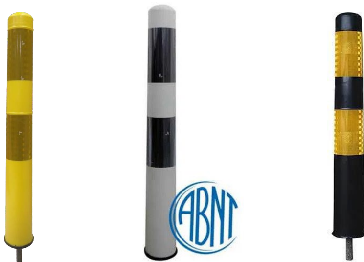
Figura Ilustrativa para Referência

Poliuretano flexível – retorna a forma original - proteção UV - MEDIDAS: 80CMX8CM – com pino para fixação – uso permanente -2 faixas refletivas TIPO VIII -tipo II da norma da película ABNT NBR 14.644/2021.