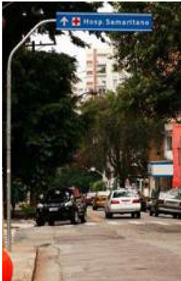
Coluna + Braço projetado P57